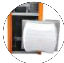
Gabinete com espaço para No-break

Jetflex Powered by rcp AUTOMATIZADORES ULTRARÁPIDOS