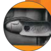
Alavanca lateral de destravamento