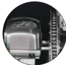
Sistema de Tração por Corrente