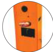
Acesso lateral da alavanca interna